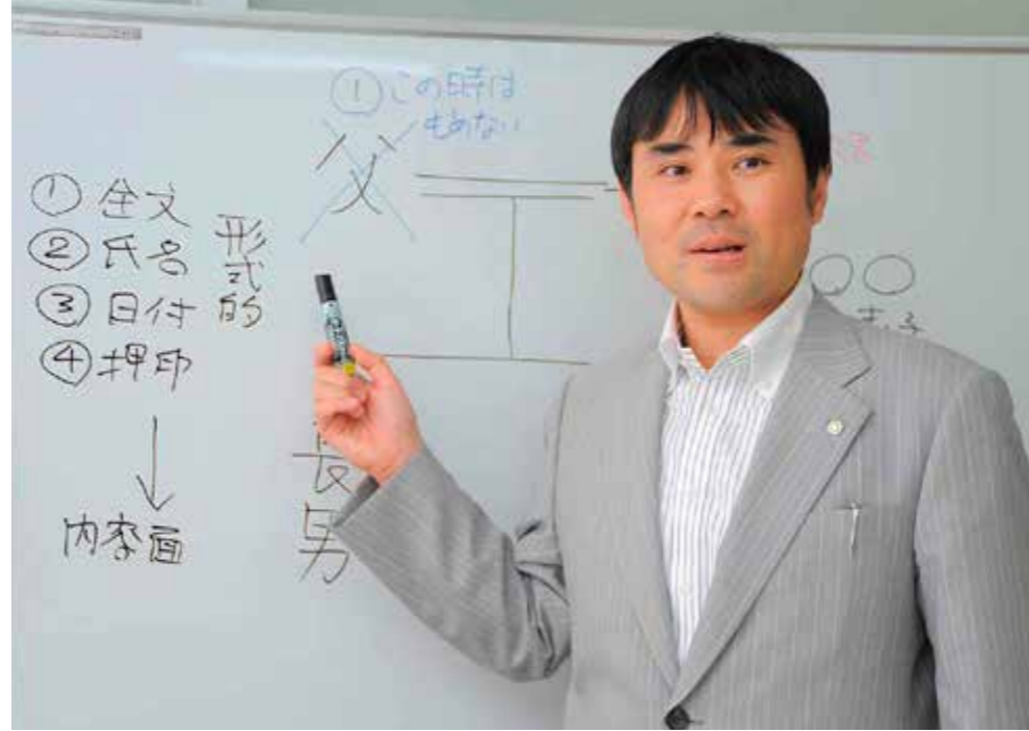
司法書士法人 長津田総合法務事務所代表

そんな「長津田総合法務事務所」が新たな挑戦に取り組んでいる。平成26年11月1日よりス