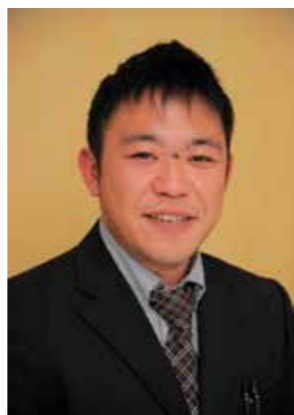
悠々百彩くらぶセンター長

「二度のお手伝い」から「長く寄り添う存在」へ。同事務所はお客様のために努力を続けていく。